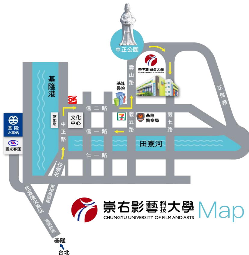
附件 9：崇右影藝科技大學位置圖