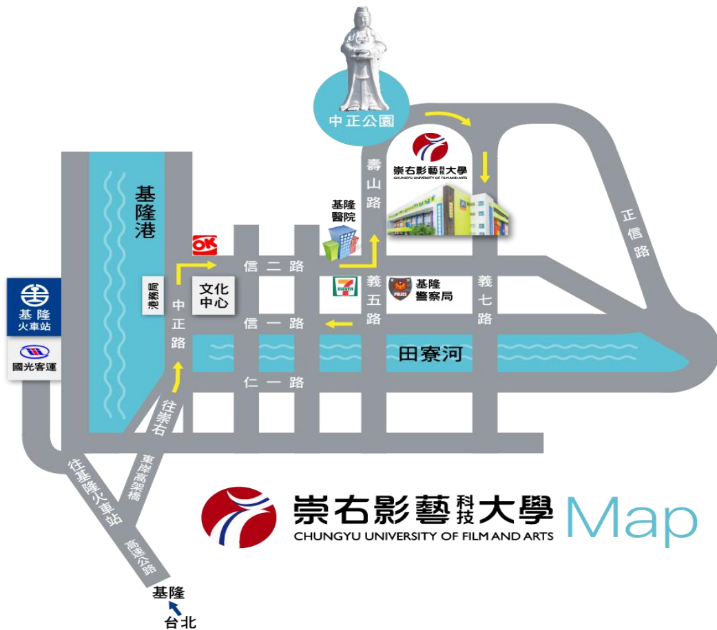
附件 8：崇右影藝科技大學位置圖