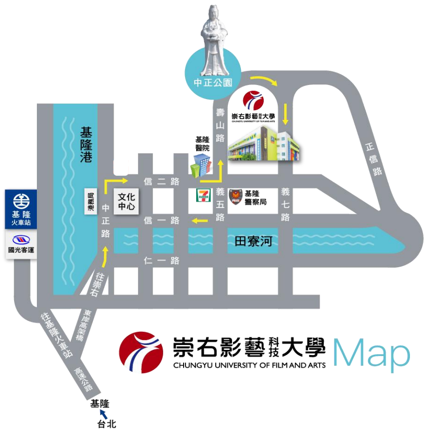
附件 8：崇右影藝科技大學位置圖